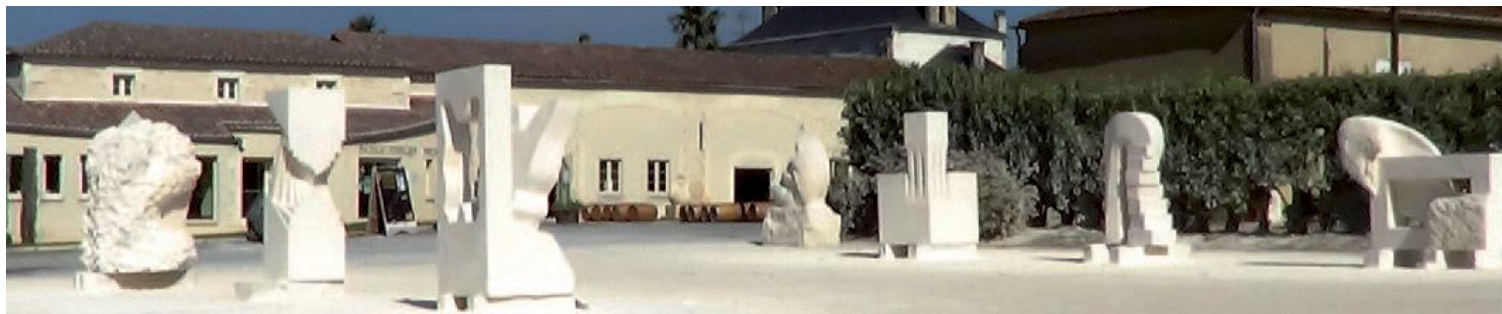
Sur la place de Julienne, les six sculptures 2014 constituent un musée en plein air dont l'entrée est ouverte à tous et gratuite, jusqu'à ce qu'elles soient adoptées pour enrichir le patrimoine culturel des communes de la région.